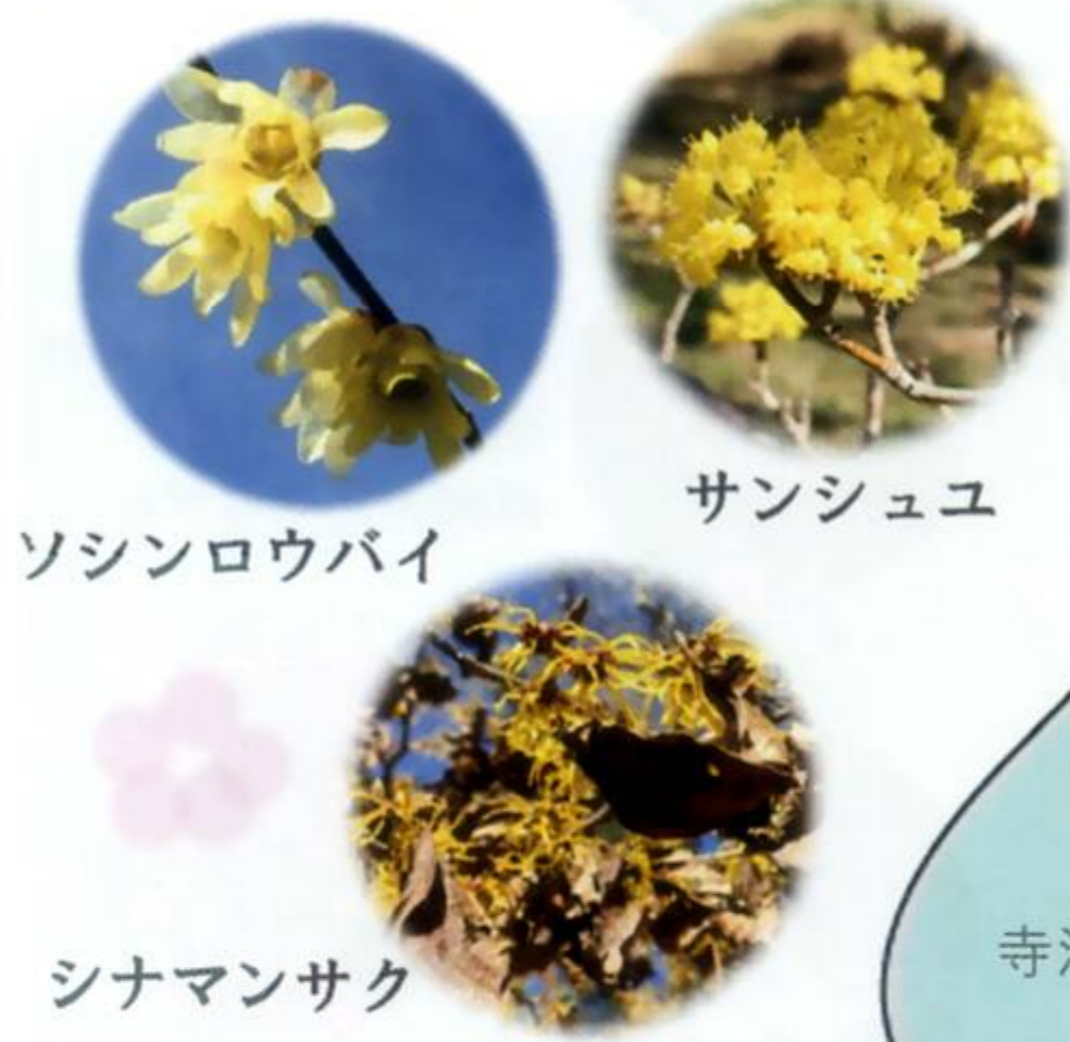
ソシンロウバイ サンシュユ シナマンサク カワセミ