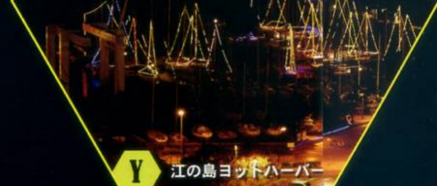
Y 江の島ヨットハーバー