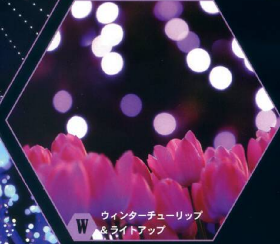
W ウィンターチューリップ & ライトアップ