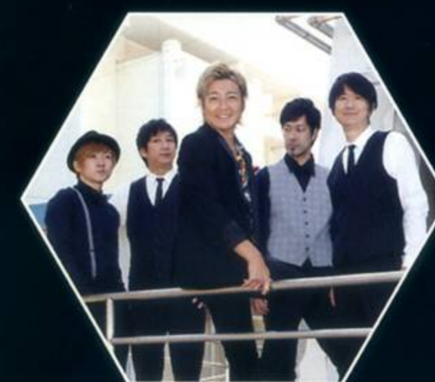
つるの剛士とシーキャンドルズ

弁財天仲見世通りから始まる全長1kmにおよぶイルミと夜景の光-michi。湘南の宝石は、江の島内各所の夜景スポットから望む湘南夜景を楽しみながら、各イルミネーション会場を巡るイルミ鑑賞スタイルがその大きな特徴です。