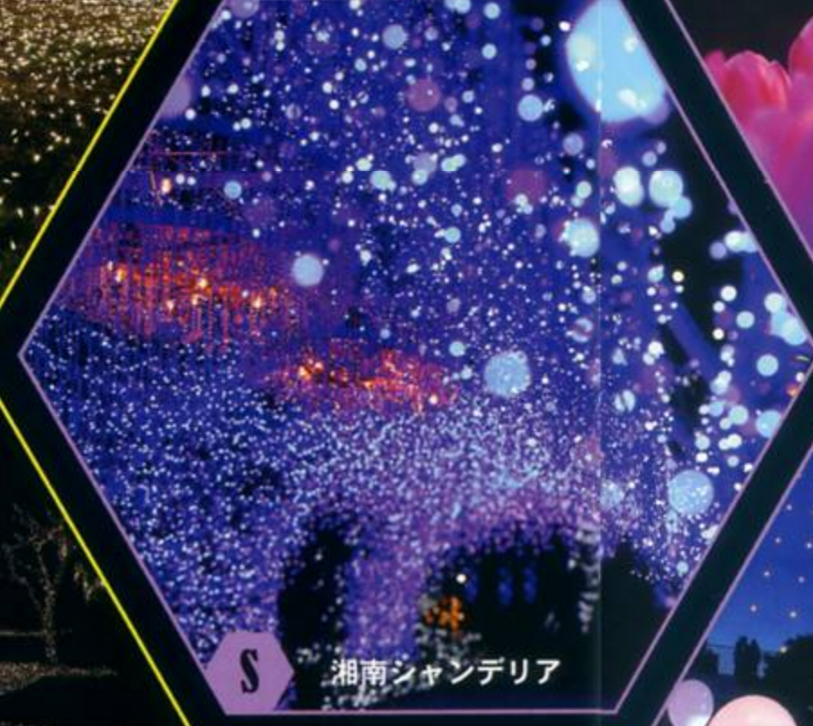
S 湘南シャンデリア