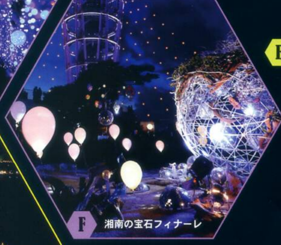
F 湘南の宝石フィナーレ